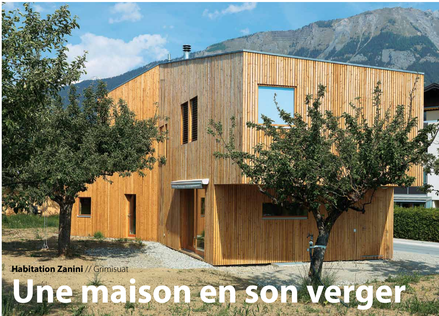
Habitation Zanini // Grimisuat