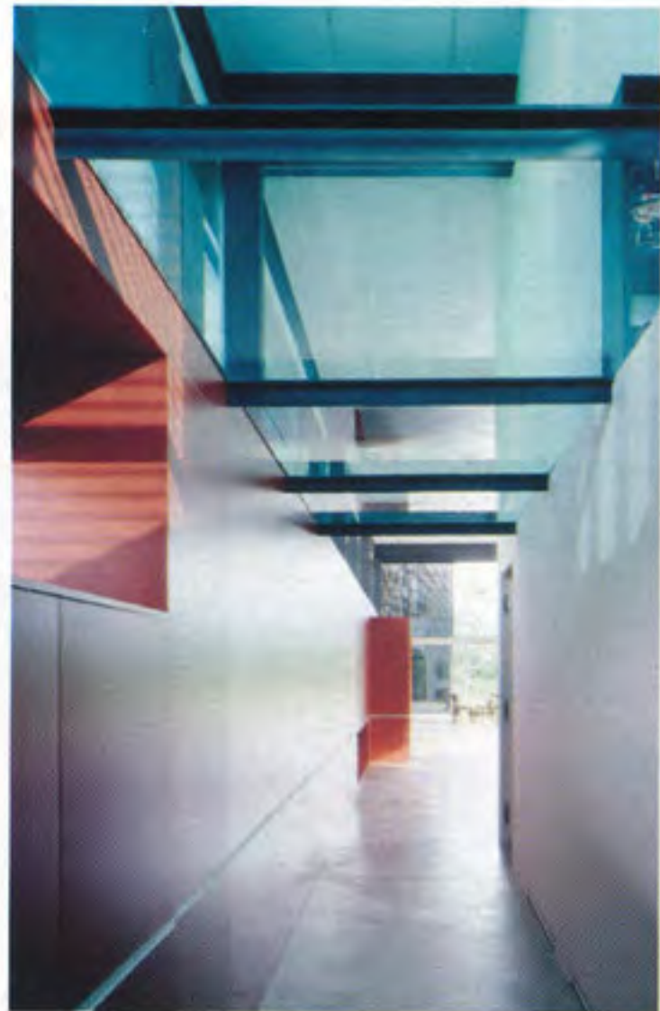
Le dépouillement maximal...

Lorsqu'ils auront quitté le domicile familial, nous pourrons récupérer cet espace. La maison bouge, tout est en mouvement.» Les surprises ne sont pas encore terminées. Après avoir emprunté un escalier en acier, l'habitation se prolonge sur une superbe terrasse qui offre un panorama unique. Plutôt que du gazon, les propriétaires ont choisi de planter de la prairie fleurie. «L'été, les sauterelles, les oiseaux et les chauves-souris sont nos compagnons de lecture. C'était vraiment le but recherché. Notre maison dialogue avec la nature», conclut l'architecte.