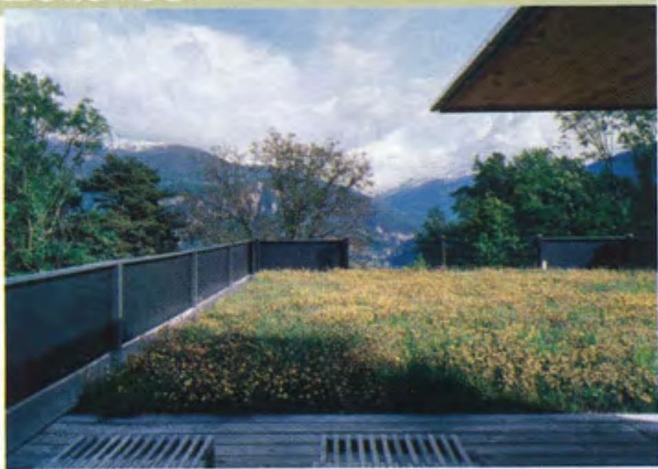
La terrasse, la prairie, le ciel, les montagnes...