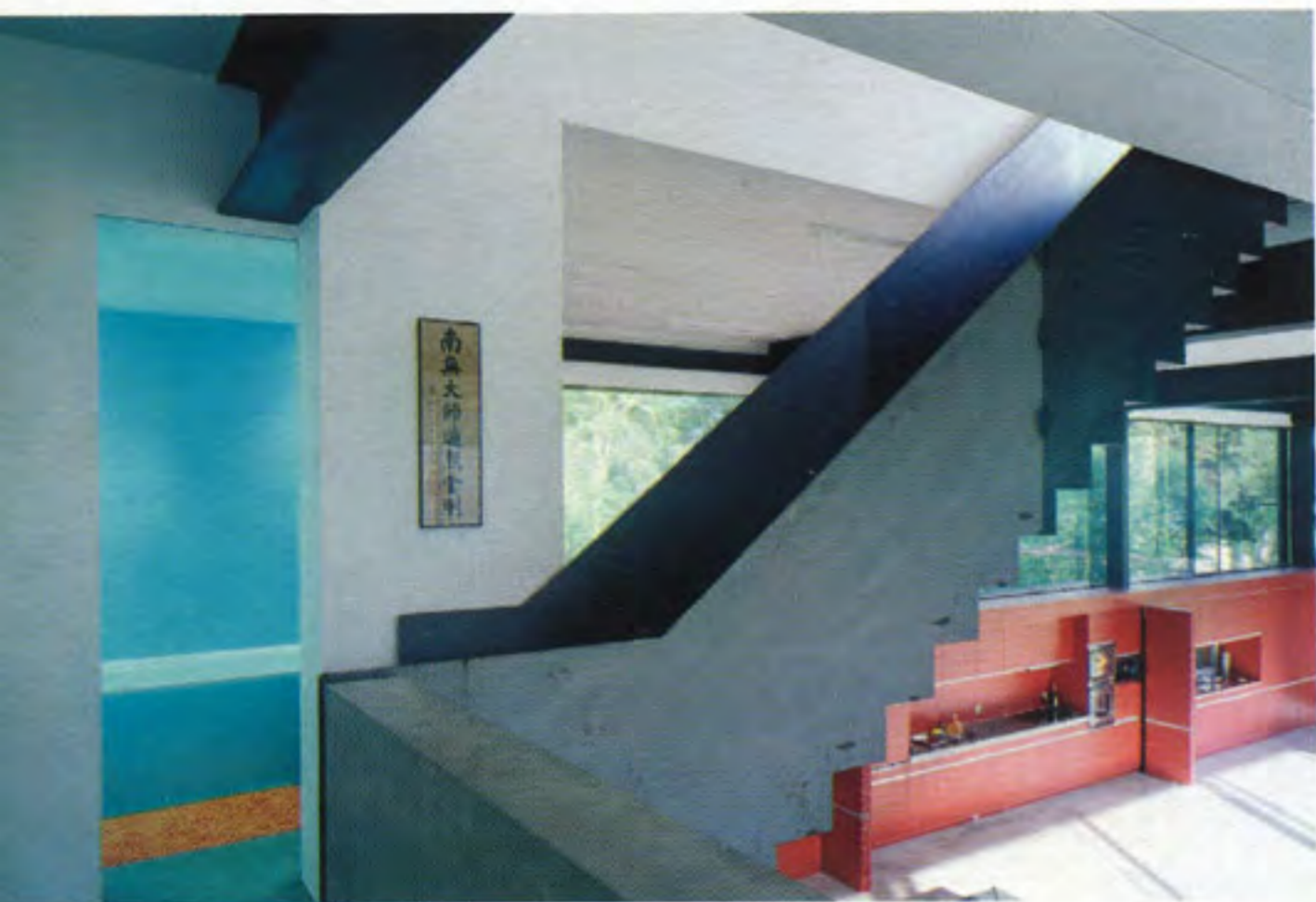
On monte sur la toiture...