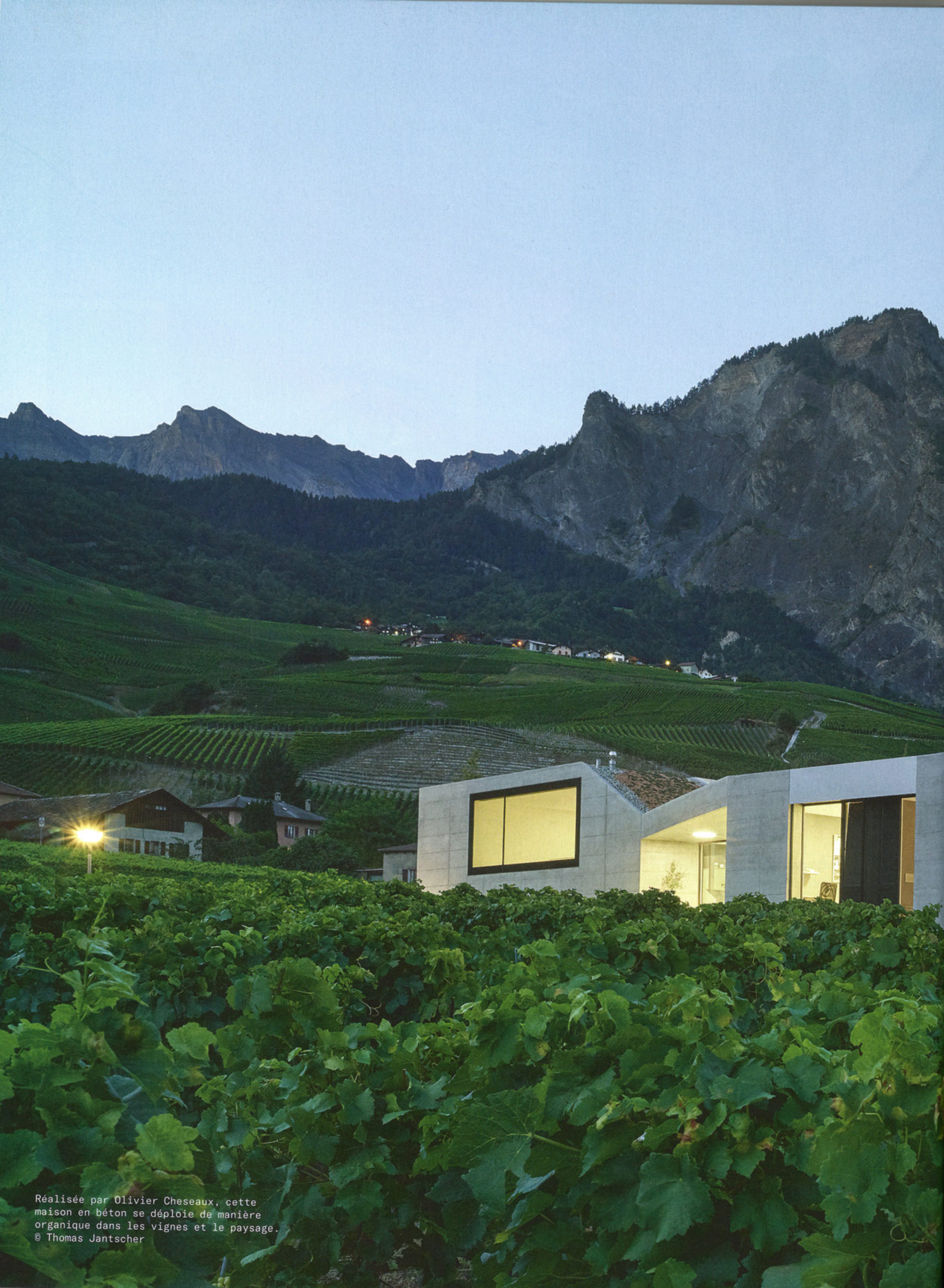
Réalisée par Olivier Cheseaux, cette maison en béton se déploie de manière organique dans les vignes et le paysage.