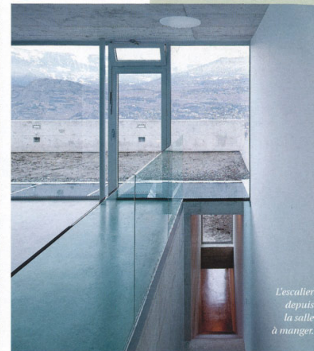
L'escalier depuis la salle à manger.