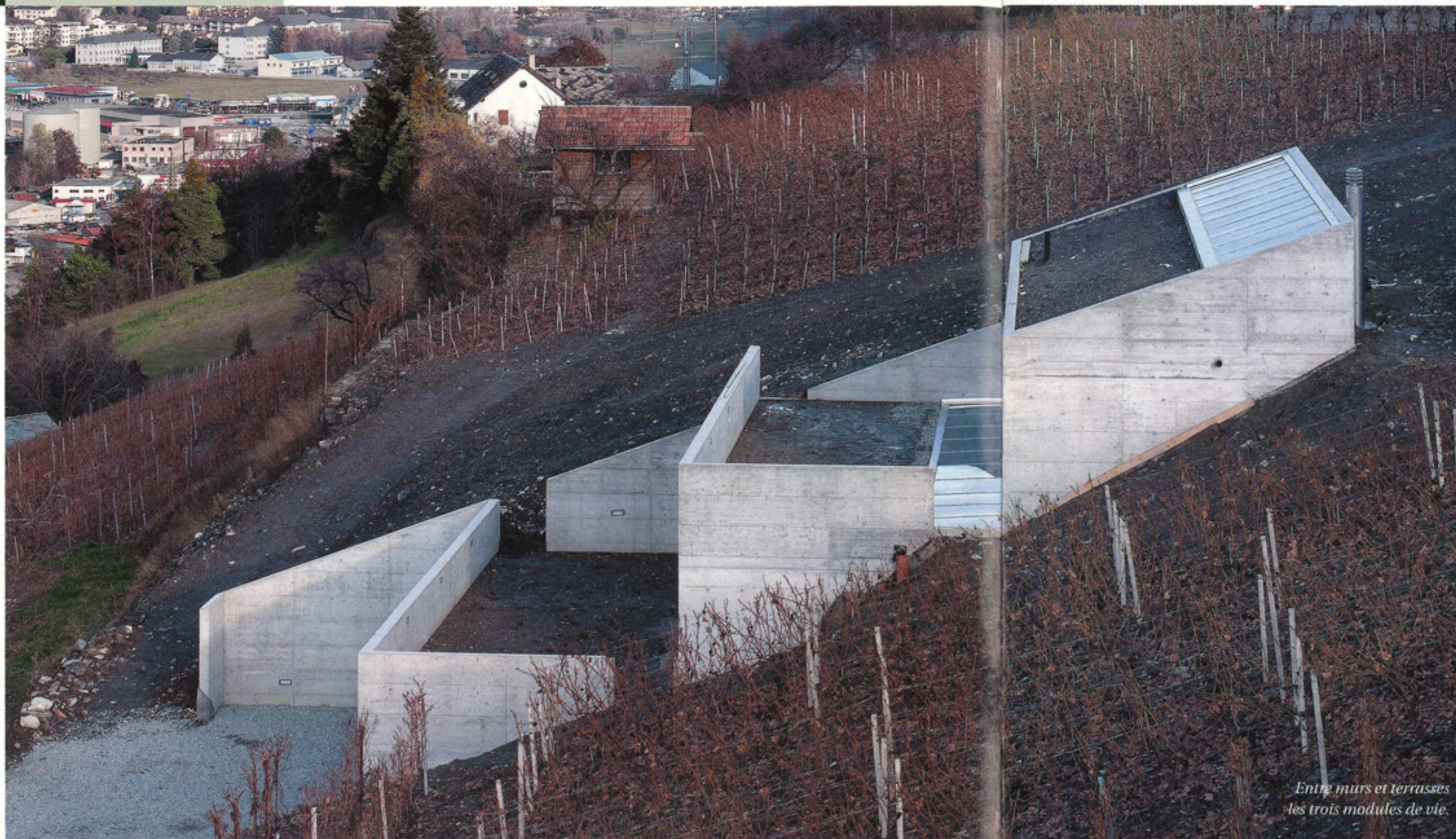
Entre murs et terrasses les trois modules de vie.